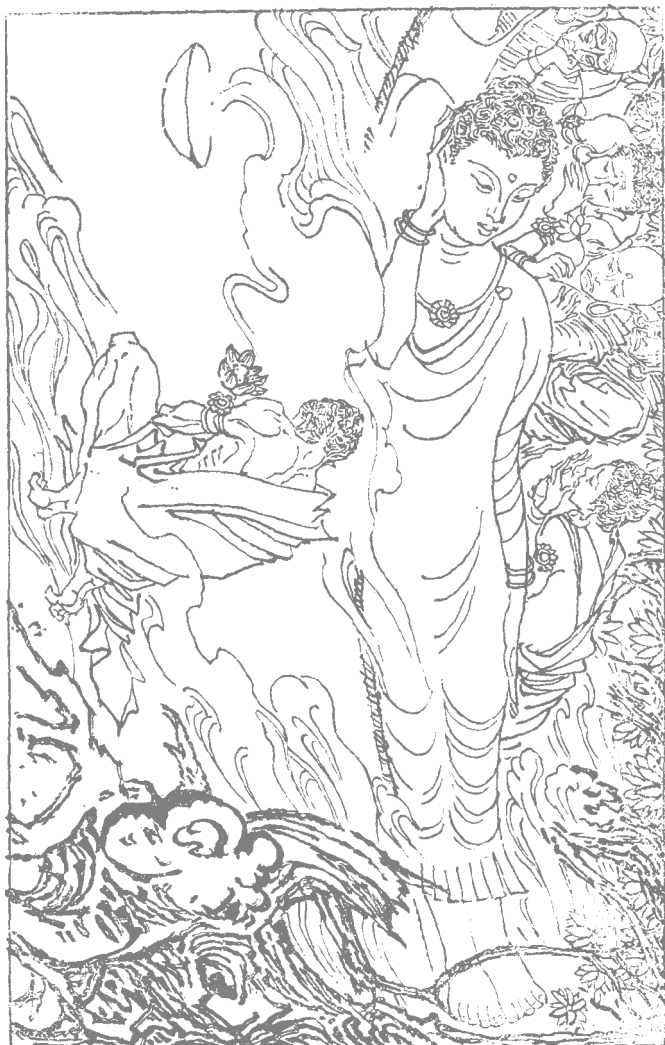
释迦牟尼逝世了，弟子们悲痛万分。