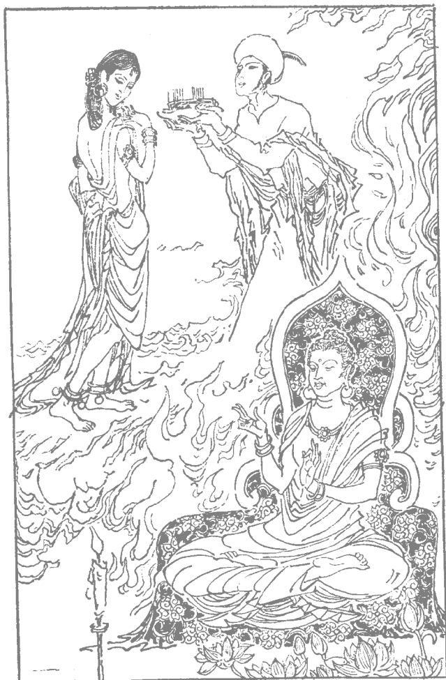
姑娘对那个卖针青年也产生了爱慕之情