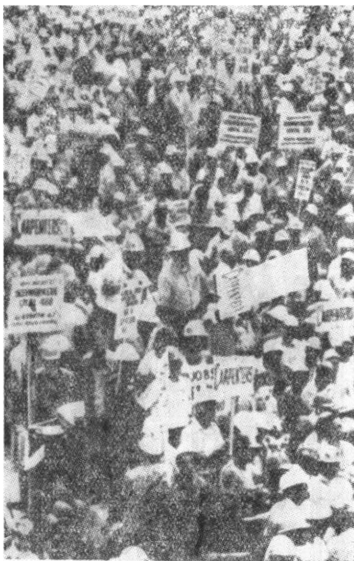
美国新泽西州的失业建筑工人举行示威，反对通货膨胀和要求就业。

失业人数已达七百五十万。汽车业和建筑业的失业情况更为严重，一九七四年十二月，汽车业的失业率达百分之二十，建筑业的失业率达百分之十五。